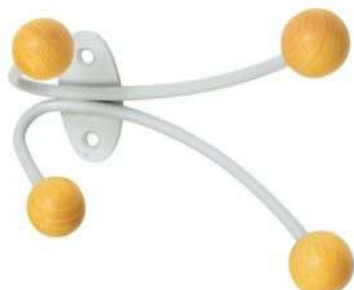
PRZYKŁADOWY WIESZAK I ZAMEK